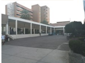
HGR No. 1

Contamos con excelentes campos clínicos: